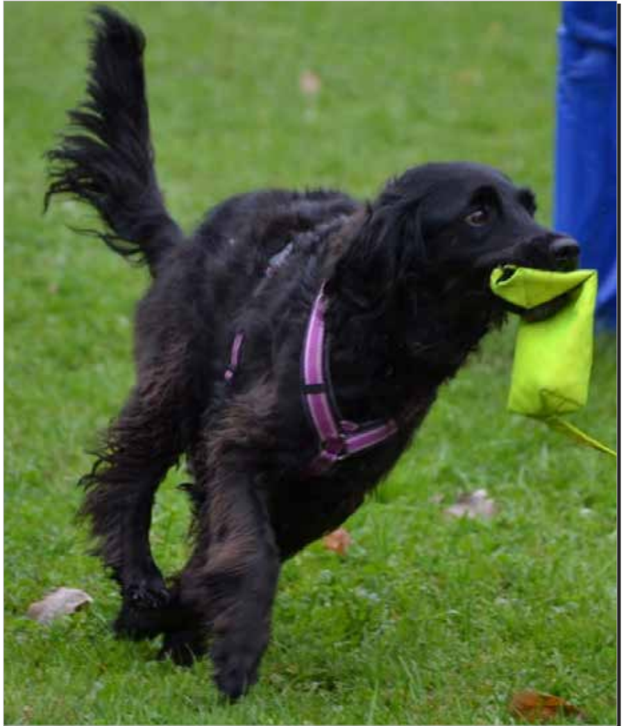
Abby im Freilauf

Tracker heißt das Zauberding, das uns zeigt wo unser Hund ist.