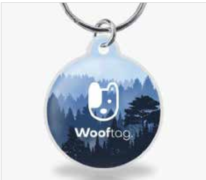
Der Bluetooth-Tracker, ohne Abo

Aber was, wenn der Hund nicht gefunden wird?